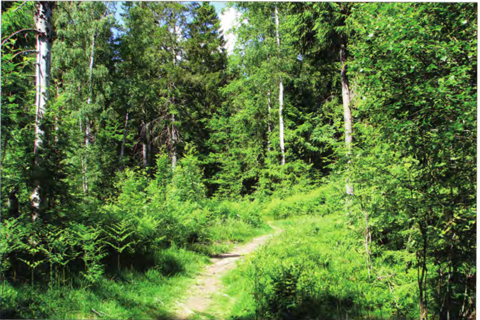
Her ved Sandmoen skal det ha vært en gammel militær ekserserplass, trolig fra 1600- eller tidlig på 1700-tallet.

Sigrid Undset har sikkert fra sin tid i Hvitsten kjennskap til, og