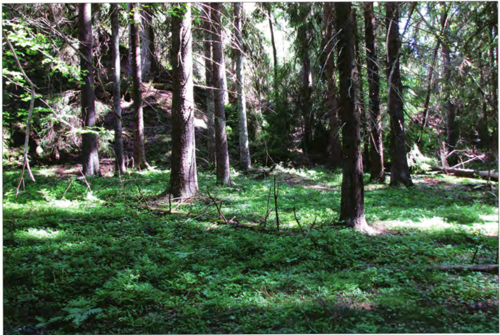
Torvet ovenfor Kjeppestadbukta er en liten slette i skogen. Her skal det ha vært en gammel markeds plass før Drøbak overtok handelsvirksomheten i området. Torvet var kanskje i bruk på 1500- og tidlig på 1600-tallet.

Til høyre utsnitt av kartet Mil 46 SV/4 fra 1799. Originalen er i målestokk 1:10.000 og utarbeidet av Ramm og Juell. På kartet ser vi den omtalte veien fra Vestby over Solbergelvas nedre løp og nordover forbi søndre Solberg, men den mindre veien fra Sandmoen til Kjeppestad er ikke å se på dette kartet. Med tillatelse fra Statens kartverk har vi merket av Kjeppestadbukta, Torvet og Sandmoen på kartutsnittet