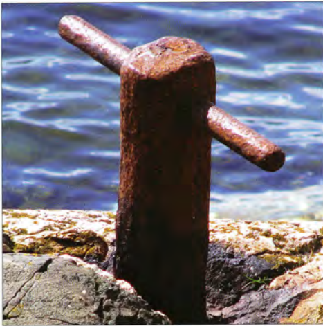
Gammel fortøyningsbolt ved Kjeppestadbukta, trolig fra iseksportens dager.

Til høyre utsnitt av kartet Mil 46 SV/4 fra 1799. Originalen er i målestokk 1:10.000 og utarbeidet av Ramm og Juell. På kartet ser vi den omtalte veien fra Vestby over Solbergelvas nedre løp og nordover forbi søndre Solberg, men den mindre veien fra Sandmoen til Kjeppestad er ikke å se på dette kartet. Med tillatelse fra Statens kartverk har vi merket av Kjeppestadbukta, Torvet og Sandmoen på kartutsnittet