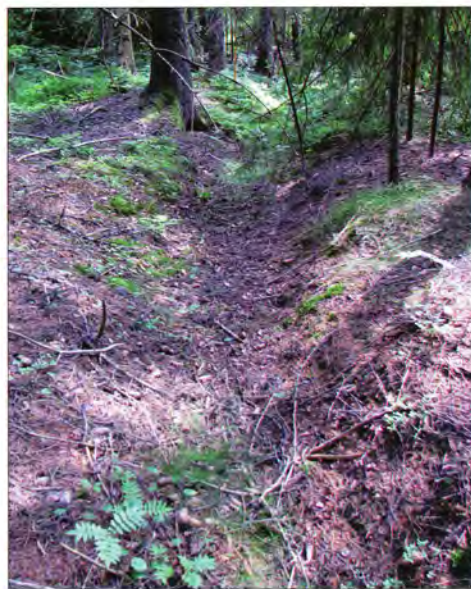
Gammel hulvei ved Sandmoen. Slike hulveier har en forsenket U-form på grunn av erosjon og lang tids ferdsel av folk og hester.

Når jeg nå skriver om vei, vil jeg gjøre det klart at det her ikke er tale om en bred, fin vei. Det gjelder her vei til øde og ubebodde steder i skogen. Men slik jeg minnes denne fra min